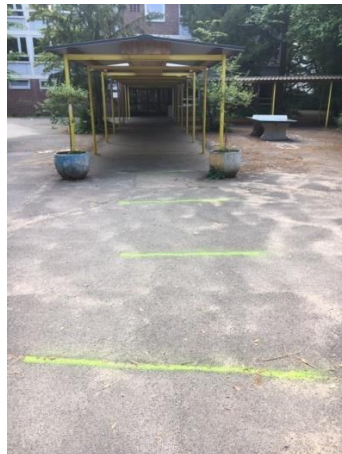
Linien bieten Orientierung und helfen beim Abstand halten