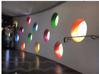
neu gestrichenes Treppenhaus