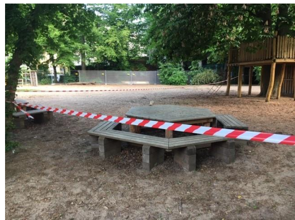
Zonierter Schulhof – von Präsenztage zu Präsenztage wechseln die Gruppen die Zonen

Ihre Kinder waren sehr diszipliniert und haben die Regeln „Wie gehe ich in meine Klasse?, Wie halte ich Abstand, Wie ziehe ich meine Maske auf und ab?...“ sehr gut umgesetzt. Wer morgens am Schultor war und dies beobachtet hat, wird uns Recht geben. Es bedarf nur noch wenig Unterstützung und auch die Abläufe am Präsenztage schleifen sich immer mehr ein. Vielen Dank auch, dass Sie uns zu Hause so gut unterstützt und das Masken tragen, Abstand halten, Hände waschen mit Ihren Kindern geübt haben.